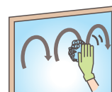
拭き方 (すりガラス)